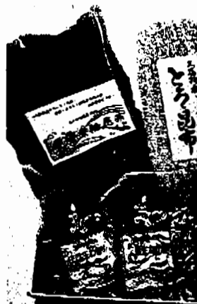
特手県野田村特産の...

者が集まり、得意分... 野をながして七つの... ロジックを進めてい... る。