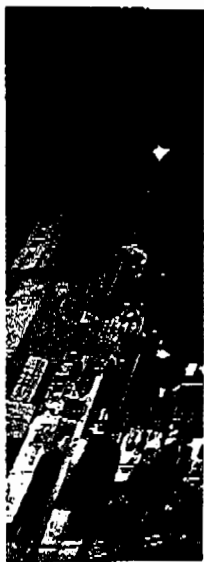
シンボルのネオンが流れた歌舞伎町... 町(3月18日)梅枝(左)と...

者が集まり、得意分... 野をながして七つの... ロジックを進めてい... る。